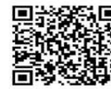
牙體技術暨數位應用科