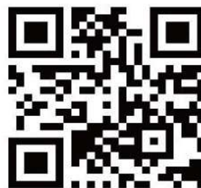
「台北海洋科技大學QR code」